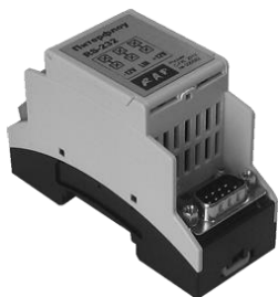
Вид адаптера со стороны разъема DB9

Адаптер RS232 (далее адаптер) предназначен для передачи измерительной и архивной информации от электромагнитных расходомеров «Питерфлоу PC» по интерфейсу RS232.