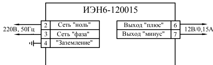
Рис. 2 Схема подключения

Примечание. После транспортирования источника при температуре ниже 10° С перед его включением необходима выдержка в нормальных климатических условиях не менее 6 часов.