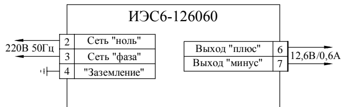
Рис. 2 Схема подключения

Примечание. После транспортирования источника при температуре ниже 10° С перед его включением необходима выдержка в нормальных климатических условиях не менее 6 часов.