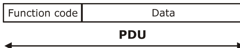
Рисунок 4: Состав PDU

Логический уровень протокола отвечает за способ доступа к данным. Протокол «Modbus» определяет понятие PDU (Protocol Data Unit), независимое от используемого коммуникационного протокола. PDU содержит 2 поля: код функции (длина 1 байт) и данные (длина не более 252 байт). Подробное описание логического уровня приведено в разделе Реализованные функции протокола .